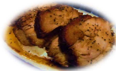
チャーシューエッグ